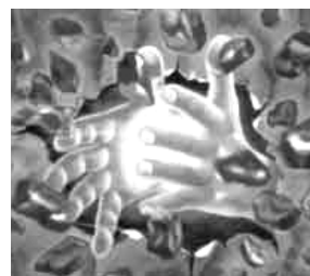
Kunstaussstellung Rudolf Werner